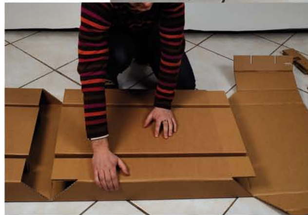
Dupliquer les opérations sur le plateau et le deuxième pied