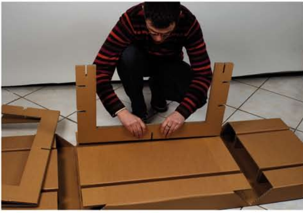
Positionnement des raidisseurs par le centre Ne pas forcer sur les côtés