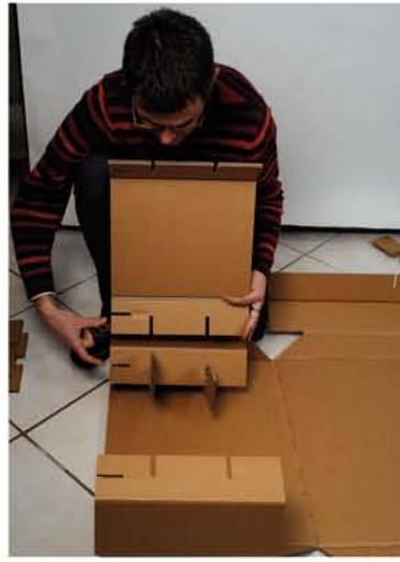
Correspondance des encoches