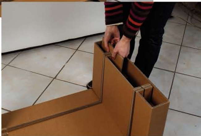
Verrouiller aux quatre coins